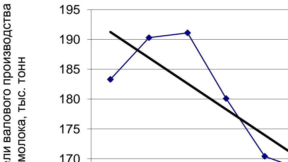
Рис. 1 – Динамика валового производства молока

Приведем пример графика временного ряда показателей валового производства молока.